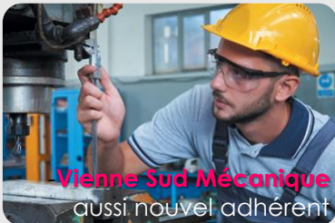
Vienne Sud Mécanique aussi nouvel adhérent

En mai et juin, l'antenne Sud-Vienne se prévalait également de cinq autres adhésions, avec :