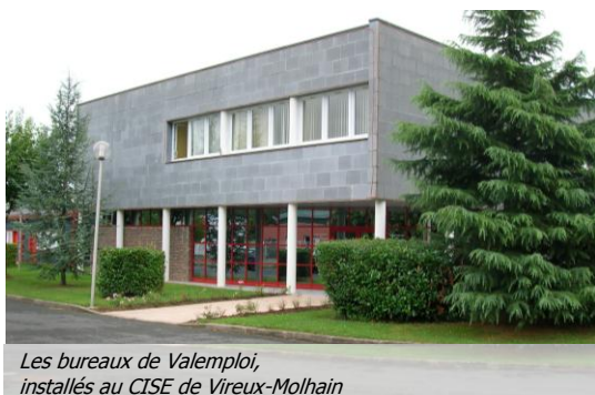
Les bureaux de Valemploi, installés au CISE de Vireux-Molhain

Depuis le 3 août dernier, Valemploi Ardennes est installé dans des bureaux du CISE (Centre d'Innovation et de Services aux Entreprises) de Vireux-Molhain. Dans des locaux spacieux d'un bâtiment parfaitement adapté à ses activités, Valemploi devient ainsi plus accessible.